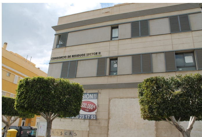
Fachada norte del edificio, junto a Calle Rosa