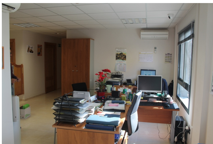
Zona de personal administrativo con vistas a calle Tulipan