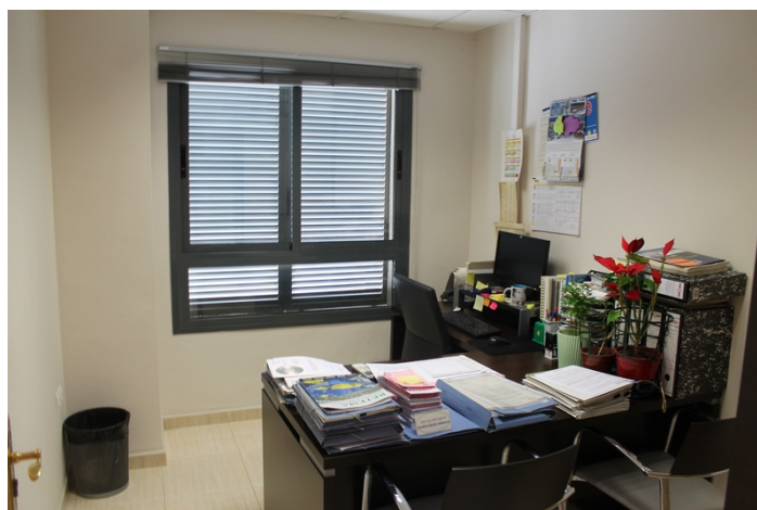
Despacho con vistas a calle Tulipan