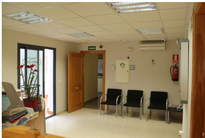
Vista zona de atención al público y detalle de entrada a patio de luces