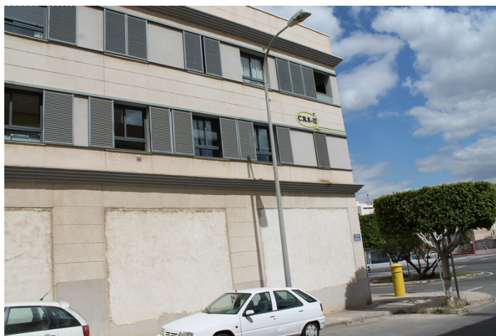
Fachada este del edificio, junto a Calle Tulipan