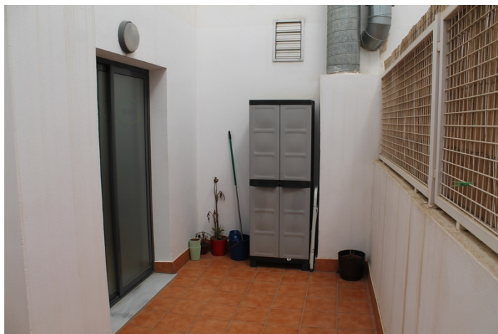
Vista de patio luces