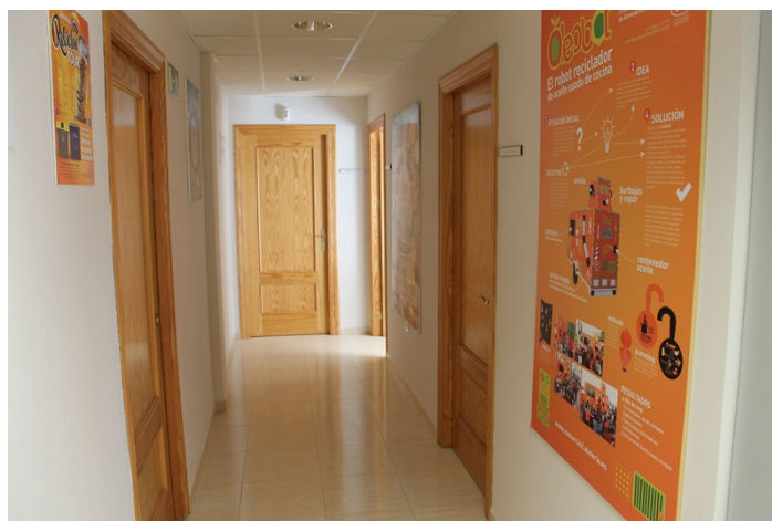
Vista del pasillo conector entre distintos despachos