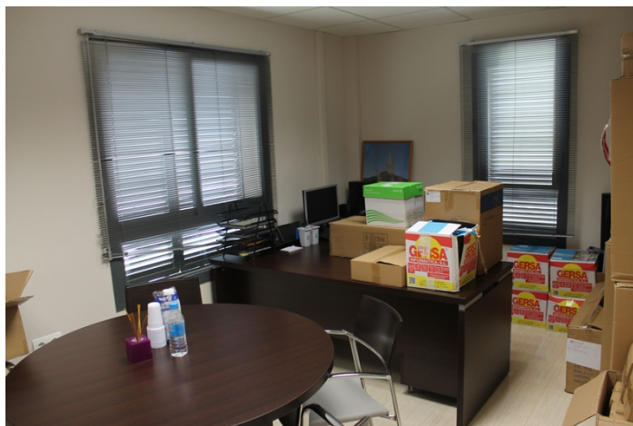
Despacho presidente con vistas a calle Tulipan y a calle Rosa