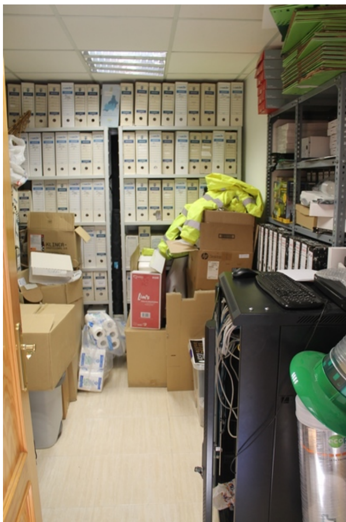
Vista de almacén