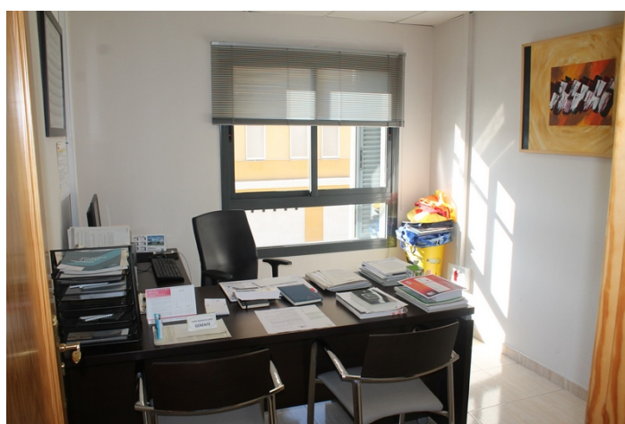
Despacho gerente con vistas a calle Tulipan