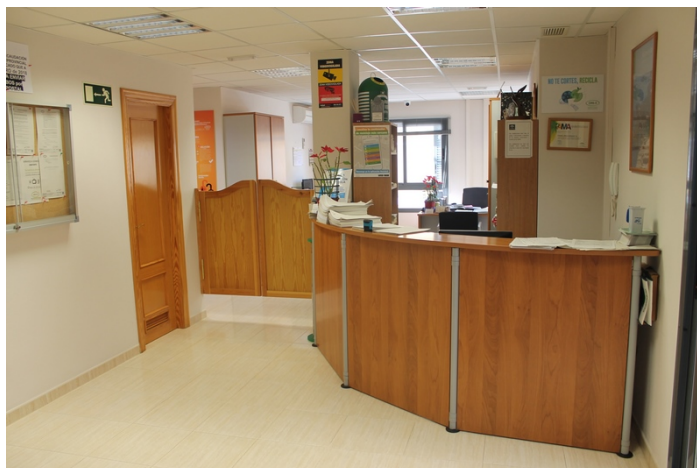
Vista recepción y detalle de mostrador curvo