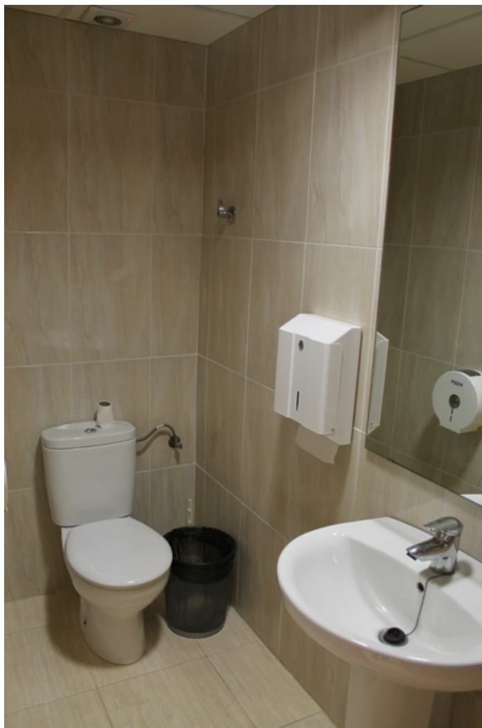
Vista de aseo