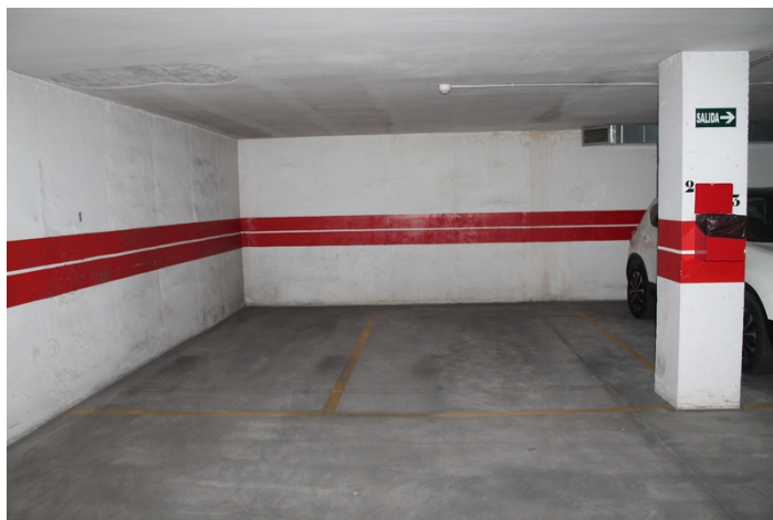
Vista frontal de plaza de garaje numero 1