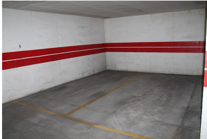
Vista lateral derecho de plaza de garaje numero 1