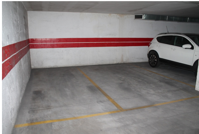
Vista lateral izquierdo de plaza de garaje numero 1